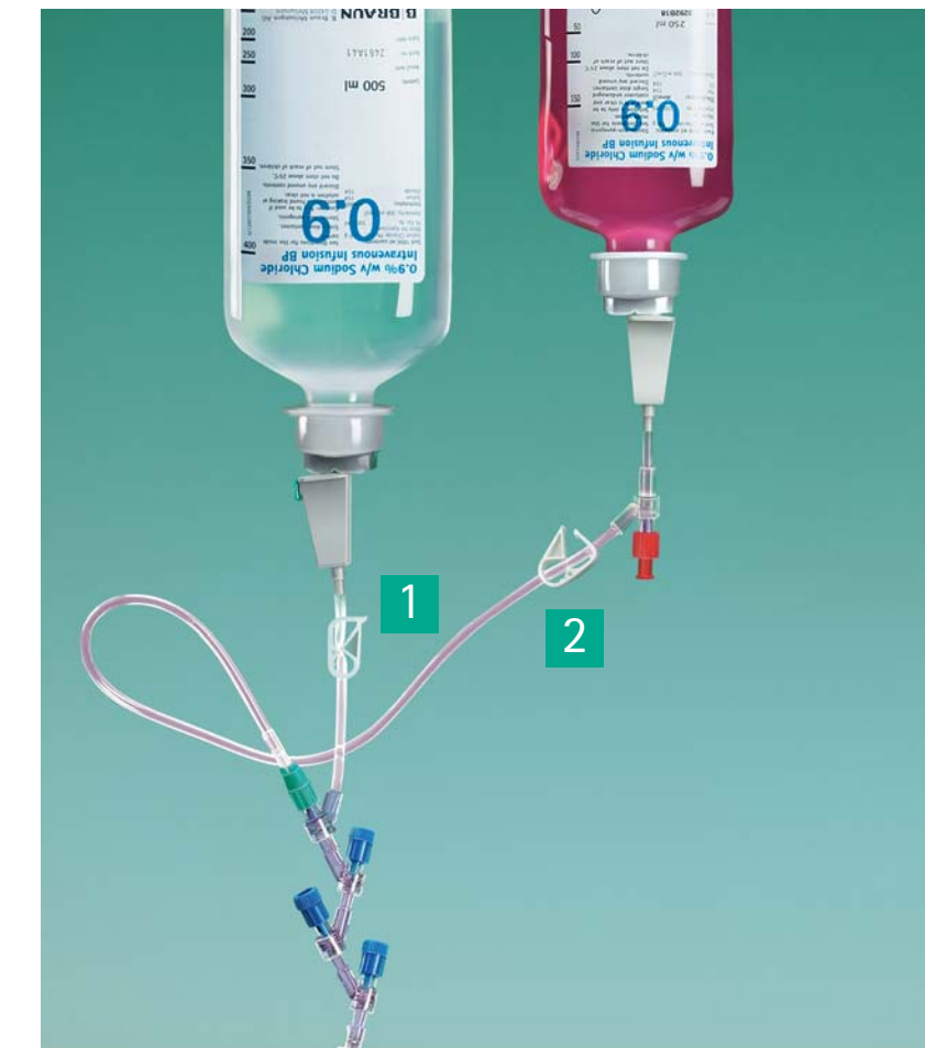
2.5 Rozpoczęcie podaży cytostatyków

Wyczuwalne kliknięcie mówi, że zestawy drenów są bezpiecznie połączone.