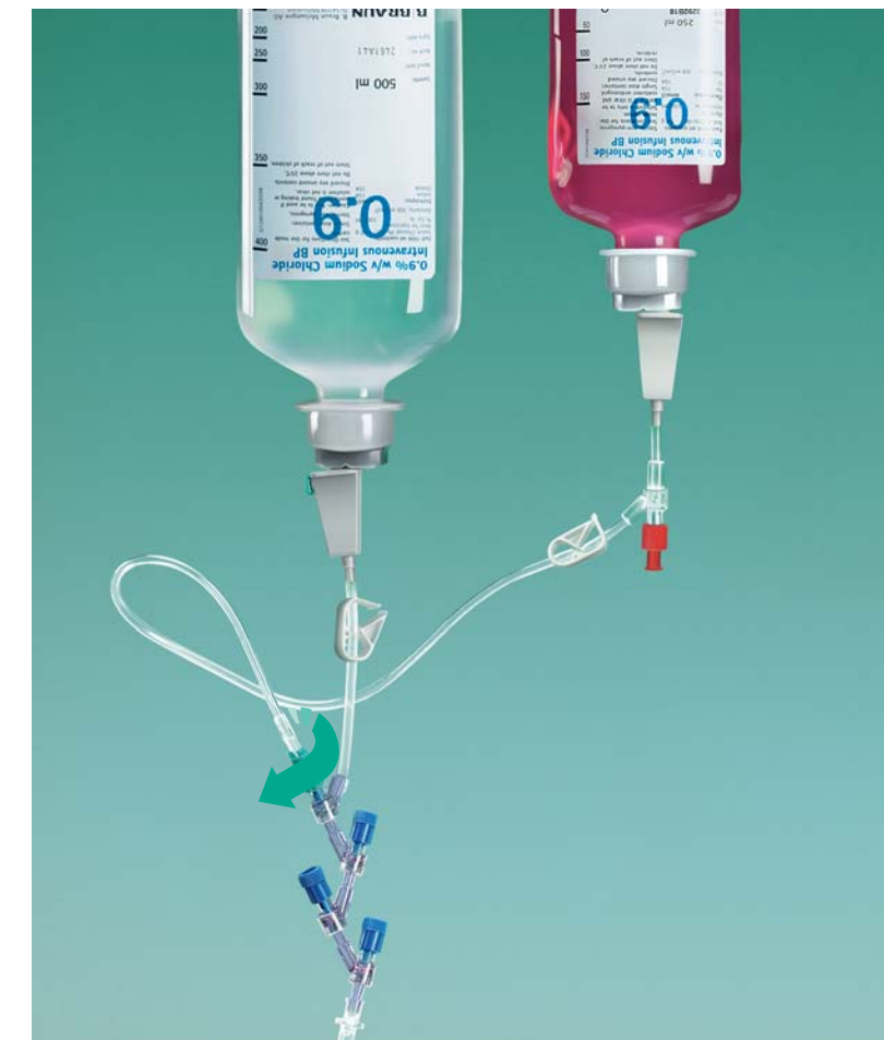
2.4 Podłączenie pierwszego drenu Cyto-Set® MIX

Otwórz zacisk rolkowy, wypełnij dren płynem do przepłukiwania drenu.