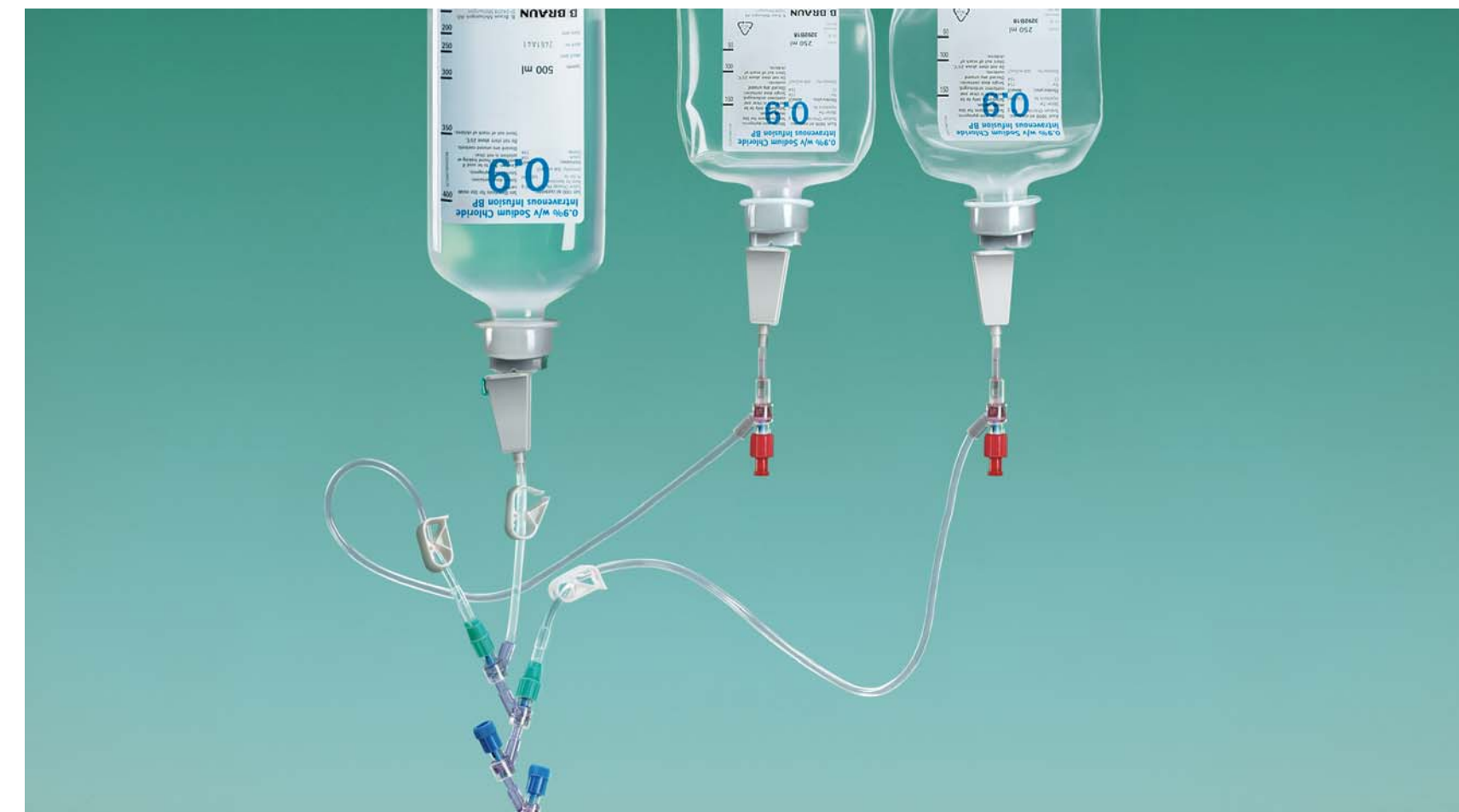
2.8 Zakończenie podaży cytostatyku

Po zakończeniu ostatniej infuzji cytostatyku, przepłucz zestaw ponownie. Zamknięty system odłącz od kaniuli dożyłnej, a następnie cały zamknięty zestaw z butelkami usuń.