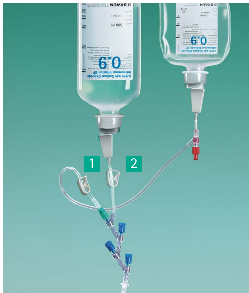
2.6 Przepłukanie drenu Cyto-Set® INFUSION