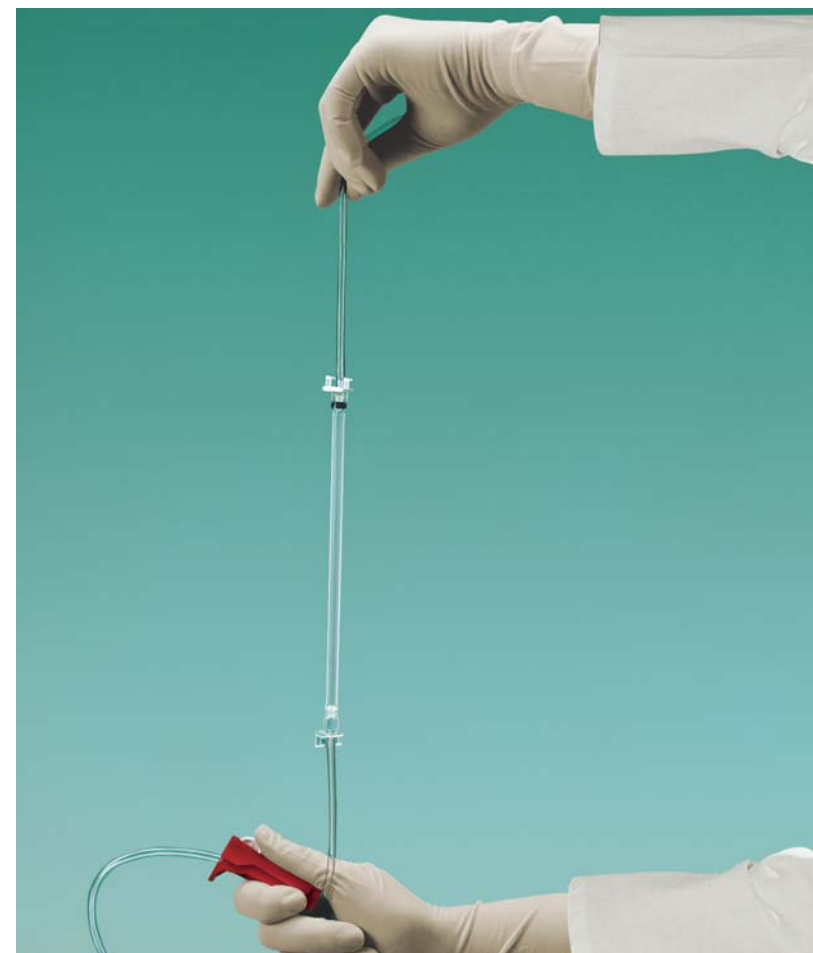
2.2 Wypełnienie drenu Cyto-Set® INFUSOMAT

Jeżeli używasz pompy infuzyjnej Infusomat Space do podaży cytostatyku, wypełniaj dren, trzymając silikonowy segment Cyto-Set® INFUSOMAT czarnym elementem do góry.