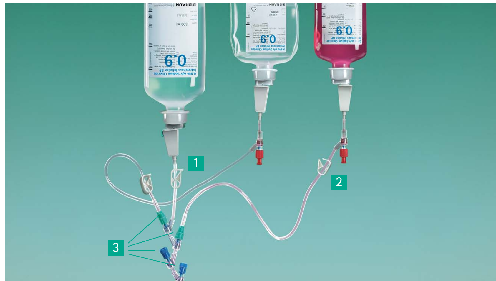
2.7 Podłączenie drugiego Cyto-Set® MIX