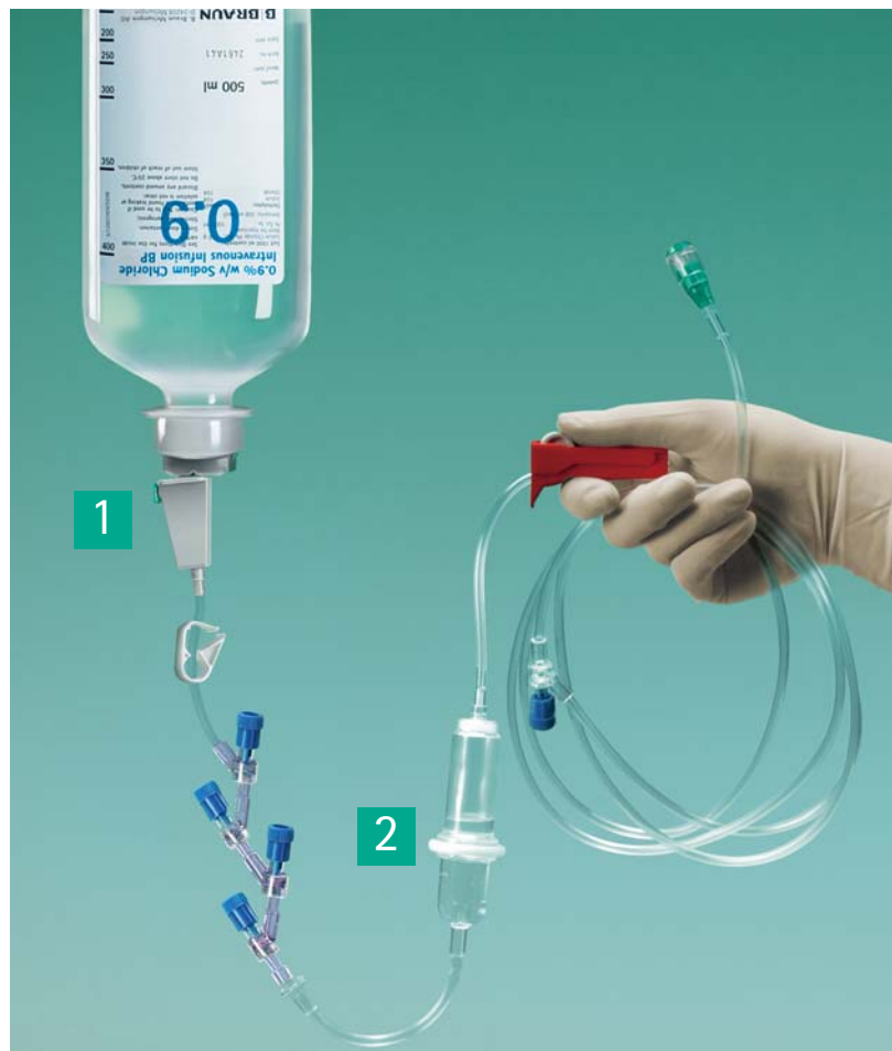
2.1 Nakłucie butelki z płynem do przepłukiwania